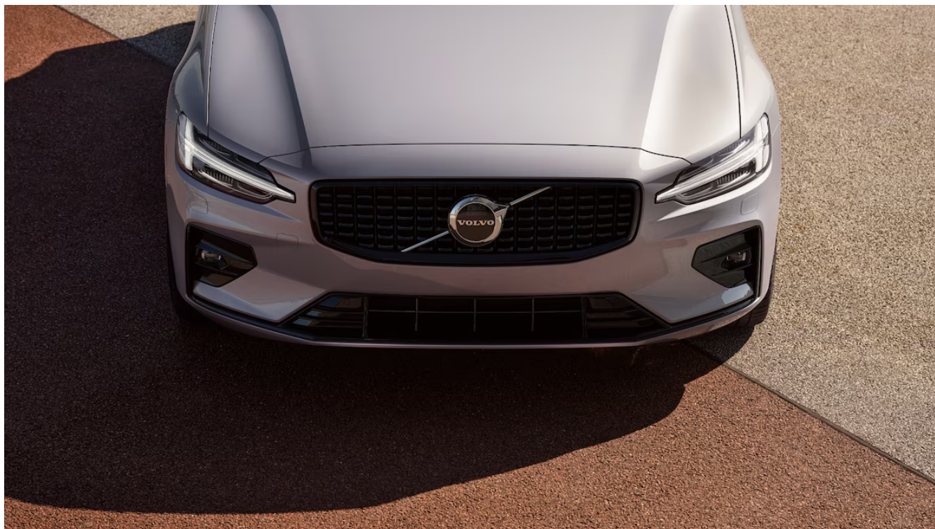
V60 Dark Ultra Exteriér

Pomocí tohoto kódu můžete svůj návrh sdílet s prodejcem Volvo