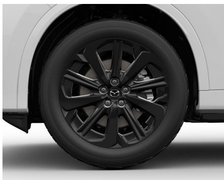
20 KOLA Z LEHKÉ SLITINY, ČERNÁ / 235/50R20_100W