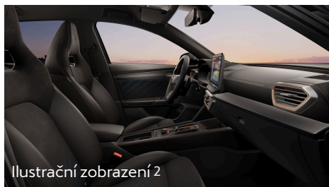
Ilustrační zobrazení 2