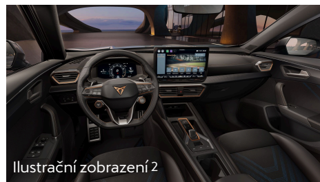
Ilustrační zobrazení 2